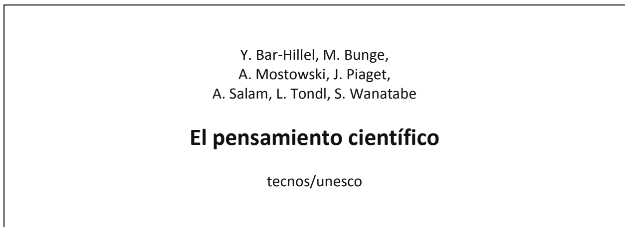
Figura 1a: Entidad libro (datos tomados de la cubierta)

Los campos son las partes en que se articula un registro. Cada campo corresponde a un atributo de la entidad. Los campos, por tanto, son zonas de información que ayudan a estructurar los datos relativos a la entidad. En una base de datos bibliográfica, por ejemplo, los registros se estructuran, típicamente, en campos como: título, autor, fuente, etc. En una tabla, los campos son las columnas de la misma. Las siguientes figuras resumen de nuevo las definiciones y las relaciones precedentes: